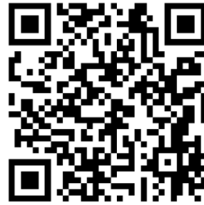
QR-Code Anmeldung Konficamp

Abschluss des Kurses bilden die Konfirmationen, bei denen wir unseren Konfirmandinnen und Konfirmanden den Konfirmationssegen für ihren weiteren Glaubens- und Lebensweg zusprechen werden. Wir feiern an verschiedenen Terminen im Mai 2023. Die endgültigen Termine werden nach Abschluss des diesjährigen Konfirmandenjahrgangs festgelegt.